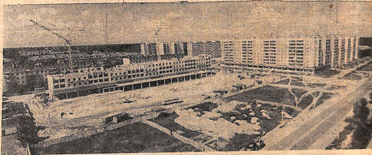
Полным ходом идет застройка квартала 8-9. На месте пустырей и старых деревянных домов возводятся многоэтажные дома с благоустроенными квартирами. Сейчас ведется строительство девятиэтажного 160-квартирного жилого дома с магазинами на первом этаже по улице Володарского. Закончить строительство предполагается в 1986 году.

М. ШАНЬГИН, председатель цехкома (Из выступления на профсоюзной конференции)